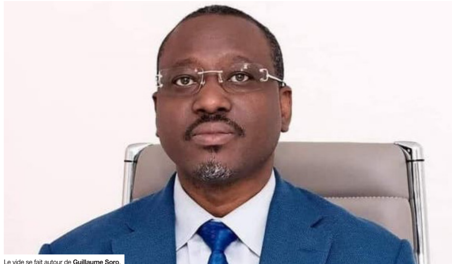
Le vide se fait autour de Guillaume Soro.