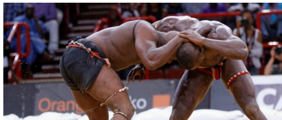
L'expérience sénégalaise dans la lutte sera bénéfique à la Côte d'Ivoire qui veut se faire aussi un nom sur le continent.

Un accord de partenariat entre la Fédération ivoirienne de lutte (FIL) et le Comité national de gestion de la lutte sénégalaise sera très bientôt signé. Cela va permettre à la Côte d'Ivoire de développer ce sport et d'acquiescer de l'expérience auprès du Sénégal, qui a toujours fait de la lutte une discipline-phare. Ce partenariat est né du voyage effectué par la 3ème Vice-présidente de la FIL à Dakar, où elle s'est entretenue avec le Président de la Fédération sénégalaise de