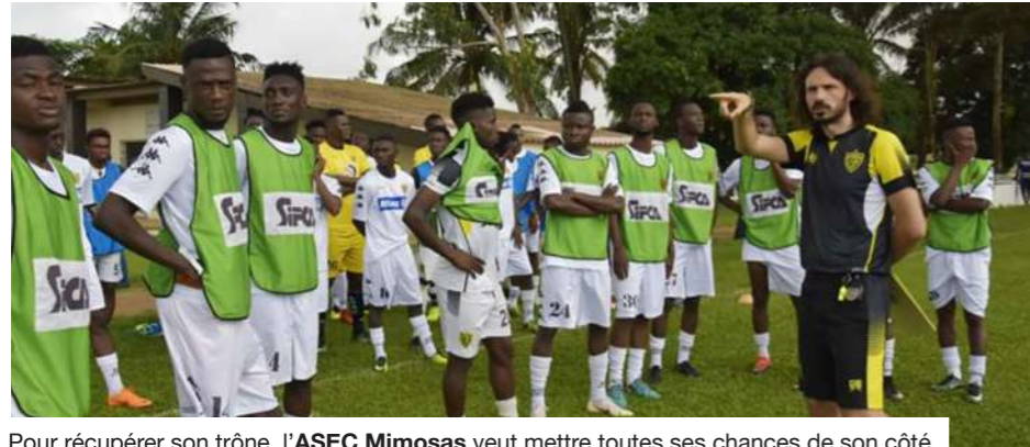
Pour récupérer son trône, l'ASEC Mimosas veut mettre toutes ses chances de son côté.

« Qui veut voyager loin ménage sa monture ». C'est ce fameux dicton que veut appliquer l'ASEC Mimosas pour revenir à son meilleur niveau et se lancer à la reconquête de sa couronne de roi du football ivoirien. Couronne qui lui échappe depuis 2018, année de son dernier titre. Ce sont la Société omnisports d'Abidjan (SOA) et le Racing club d'Abidjan (RCA) qui l'ont emporté respectivement en 2019 et 2020. Pour la saison 2021, qui va s'ouvrir très