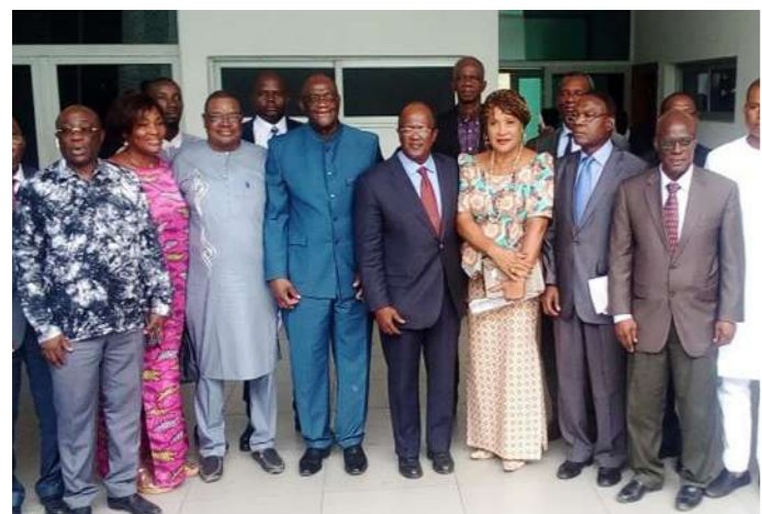
L'alliance des partis de l'opposition a éclaté.

L'union sacrée de l'opposition face au parti au pouvoir vient de voler en éclats. Chancelante au lendemain de l'élection présidentielle du 31 octobre, elle vient de se faire harakiri dans la course pour les élections législatives. Et pour cause : elle n'a pu s'entendre sur une