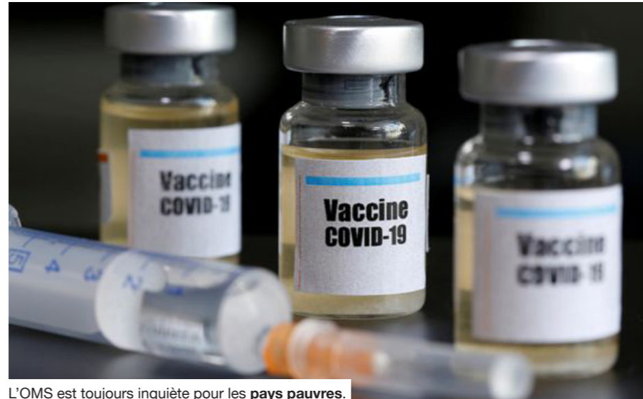
L'OMS est toujours inquiète pour les pays pauvres.

« Je dois être franc. Le monde est au bord d'un échec moral catastrophique et le prix de cet échec sera payé par les vies et les moyens de subsistance dans les pays les plus pauvres du monde », a affirmé le Directeur général. Dans un discours d'ouverture d'une réunion du Conseil exécutif de l'organisation onusienne, à Genève, il a fustigé l'attitude « égoïste » des pays riches et vivement critiqué les fabricants de vaccins, qui cherchent l'approbation réglementaire dans les États riches plutôt que de soumettre leurs données à l'OMS pour obtenir un feu