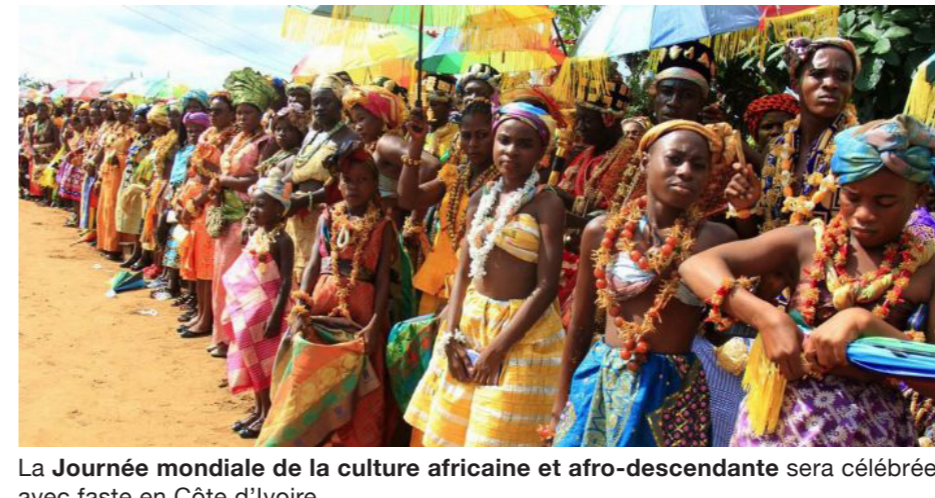
La Journée mondiale de la culture africaine et afro-descendante sera célébrée avec faste en Côte d'Ivoire.

L'UNESCO a proclamé le 24 janvier Journée mondiale de la culture africaine et afro-descendante, à l'occasion de sa 40ème session de sa Conférence générale, en 2019. Cette journée célèbre les nombreuses cultures vivantes du continent africain et des diasporas africaines dans le monde entier et les promeut comme un levier efficace au service du développement durable, du dialogue et de la paix. En tant que source riche du patrimoine mondial commun, la promotion de la culture africaine et afro-descendante est indispensable pour le développement du continent et pour